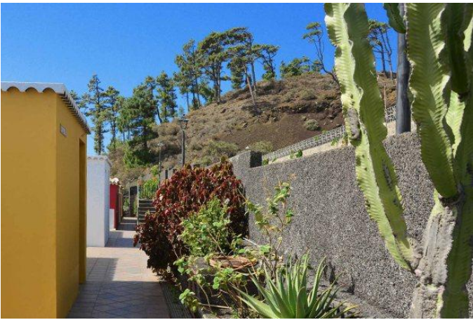
Gärtchen / Zugang