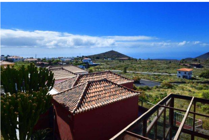
Große Terrasse mit schönem Meerblick