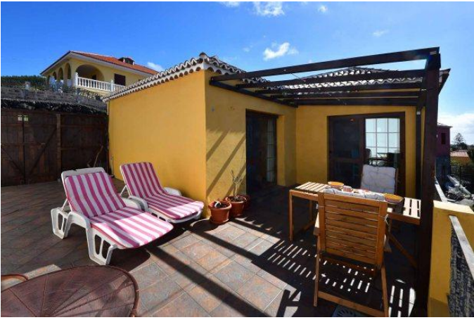
Große Terrasse mit schönem Meerblick