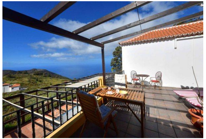
Große Terrasse mit schönem Meerblick