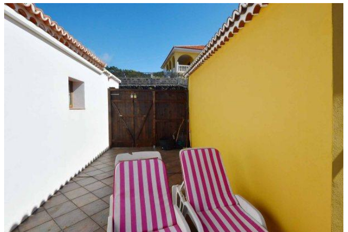
Große Terrasse mit schönem Meerblick