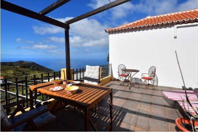
Große Terrasse mit schönem Meerblick