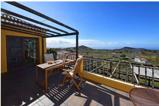
Große Terrasse mit schönem Meerblick