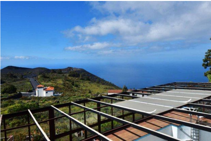
Große Terrasse mit schönem Meerblick