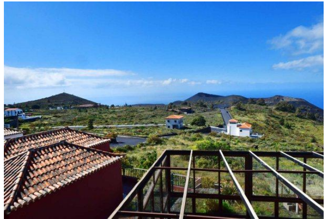
Große Terrasse mit schönem Meerblick