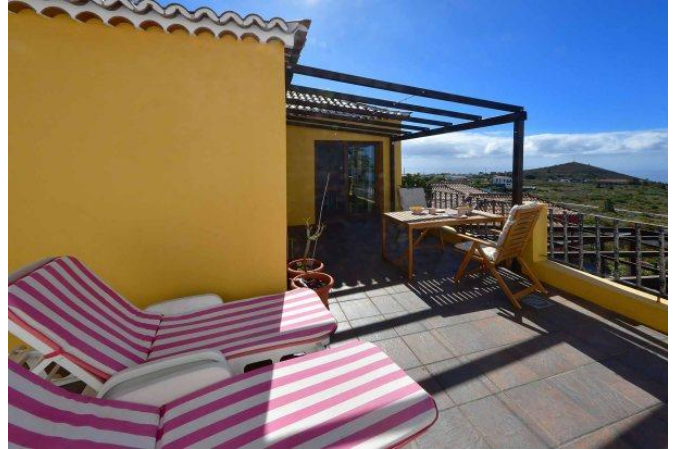
Große Terrasse mit schönem Meerblick