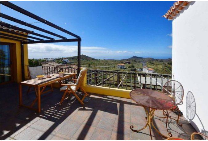
Große Terrasse mit schönem Meerblick