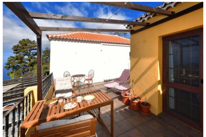
Große Terrasse mit schönem Meerblick